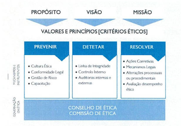
Figura I – Modelo de Integridade do Grupo AdP

O eixo “ Resolver ” integra as medidas a implementar, as metodologias de remediação para garantir a plenitude do modelo e a avaliação do desempenho ético do Grupo AdP através dos indicadores de desempenho ético.